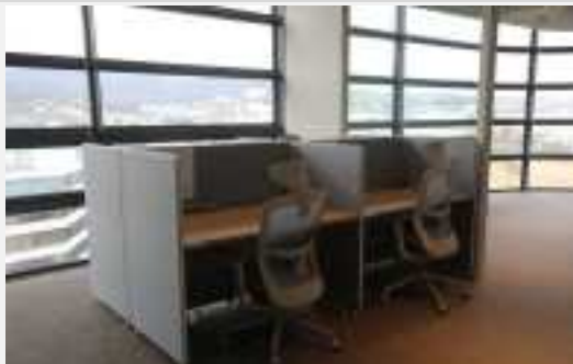
1인기업 공간 예시 (4석 中 1석)