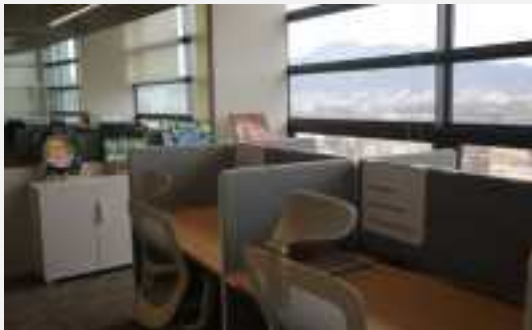
사무실(4인 공간, 약 12㎡)